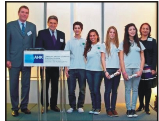
Concurso de Jóvenes Empresarios

Contamos con numerosos socios: la Embajada de la República Federal de Alemania en Buenos Aires y la Cámara de Industria y Comercio Argentino-Alemana, así como prestigiosas universidades argentinas (USAL, UNSAM) y alemanas con los cuales mantenemos relaciones estrechas.