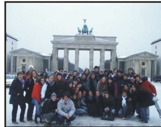
Intercambio estudiantil en Berlín