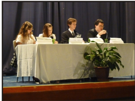
Proyecto Modelo de Naciones Unidas