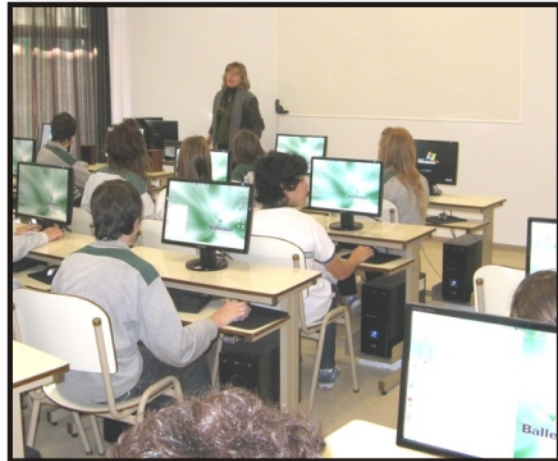
Aula de computación

El Instituto Ballester - Deutsche Schule no se destaca solamente por una larga tradición de enseñanza bicultural, sino también por su perfil pedagógico excelente e innovador. Por este motivo nuestra escuela obtuvo por parte de autoridades alemanas el sello de calidad: “ Escuela Alemana de Excelencia en el Extranjero ”. Después de una intensa semana de evaluación externa, el colegio recibió la confirmación que cumple con los más altos estándares internacionales en educación. Nuestro Colegio tiene el orgullo de formar parte de una red internacional de 140 Escuelas Alemanas en el mundo.